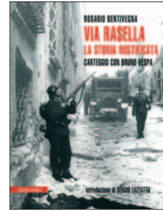
Rosario Bentivegna Via Rasella La storia mistificata Carteggio con Bruno Vespa