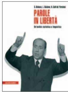
Bolasco, Giuliano, Galli de' Paratesi Parole in libertà Un'analisi statistica e linguistica