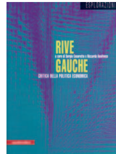
Sergio Cesaratto e Riccardo Relafonzo (a cura di) Rive Gauche Critica della politica economica

Per gli appuntamenti di questo mese vedi la nostra pagina eventi