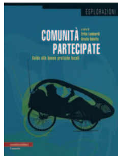
Lunaria Comunità partecipate Guida alle buone pratiche locali